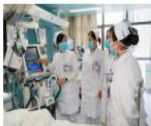
重症护理 实践教学

截至目前，为适应社会发展需求，采用“护理+X”的模式，先后开办重症护理、助产护理、血液净化特色课程班与老年护理、麻醉护理学特色课程，不断探索护理专业发展新途径。此外，在“护教协同、院校融合”模式指导下，护理学专业开办驻点教学班，采用“2+2”人才培养模式，真正实现“早临床、多临床、反复临床”。2019 年，自编教材《重症护理学》于 2019 年经人卫出版社出版。