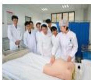
助产护理 实践教学