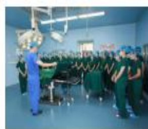
外科护理 实践教学